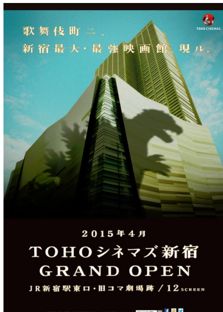
TOHOシネマズ新宿ポスター