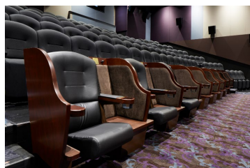
※プレミア ボックス シート®