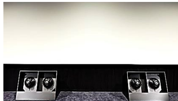
※スクリーン下に設置されたサブウーハー

TOHOシネマズ池袋に導入し、好評を博している「音の体感・迫力あるサウンド」を意識したシアター。アイソバリック方式を採用したサブウーハーを導入。アイソバリック方式はスピーカーユニットを向かい合わせで駆動させることで、通常のサブウーハーの1.5倍～2倍のパワーを発揮します。TOHOシネマズ以外では体験できない、空気を震わせる体感型サウンド・シアターを実現します。