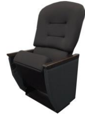
フロントリクライニングシート™

座席の最前列に配置された本シートならではの迫力を体感できます。リクライニングしていただくことで、リラックスしながら映画の世界に没入することができます。