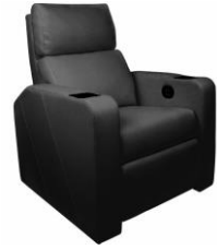
プレミアラグジュアリーシート™

フットレストの付いた革製の電動リクライニングシートで、よりラグジュアリーに、ゆったりとした空間で映画をご鑑賞いただけます。