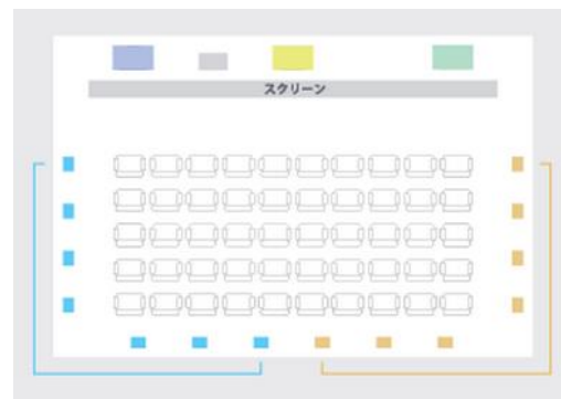
[ 従来の 5.1 チャンネル ]

ドルビーアトモスのスピーカー配置は、5.1 チャンネルのサラウンドスピーカー配置に、「オーバーヘッドスピーカー」、「追加のスクリーンスピーカー」、「追加のサイドサラウンドスピーカー」、「サラウンド用のサブウーファー」を追加し、それらのスピーカーのすべてを個別に制御し、正確な音の配置と、自然でリアルな音の移動を実現します。